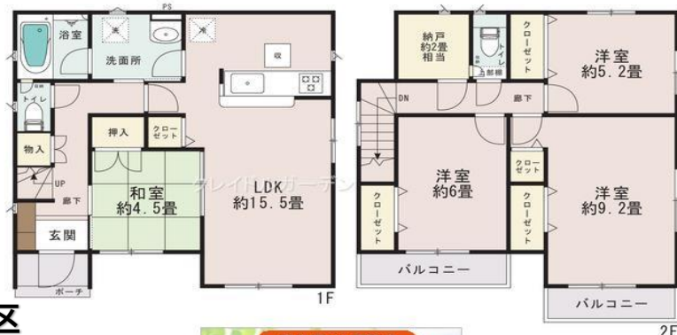
青森県の不動産 十和田宅建メイト