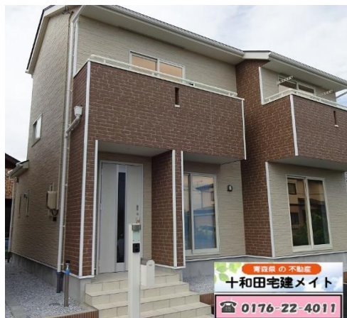
青森県の不動産 十和田宅建メイト ☎ 0176-22-4011